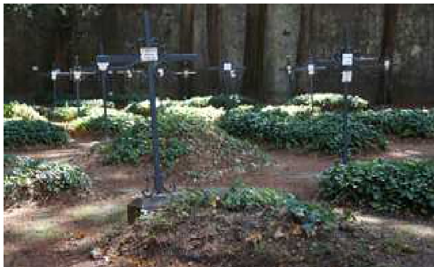
Cimetière des moines, à l'abbaye d'Aiguebelle