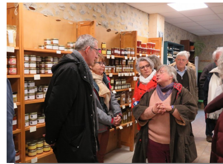
Visite du local des producteurs à Rémuzat