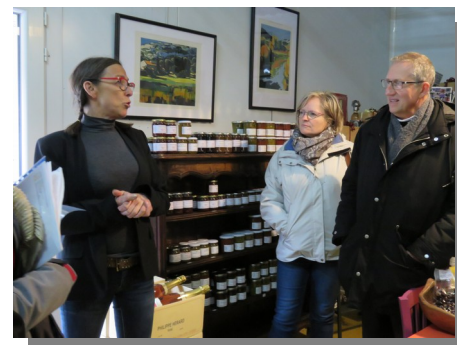
Visite de la conserverie à Rémuzat